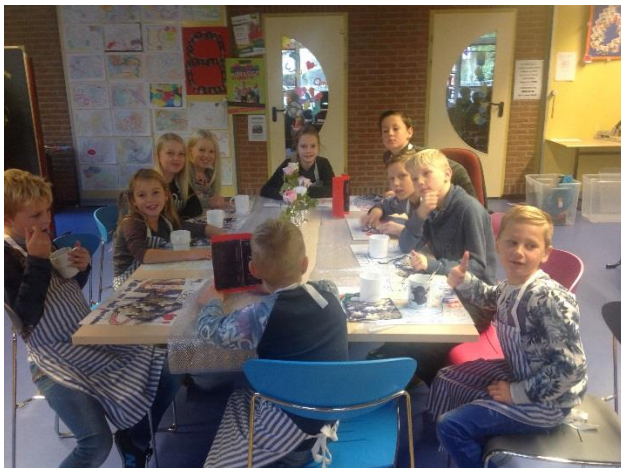
Waar blijft de soep?

Voor de gelegenheid hebben we op school een complete keuken ingericht. Een aantal enthousiaste ouders begeleidt de kinderen bij de kookles. Als het gerecht klaar is wordt het uiteraard gezellig samen opgegeten.