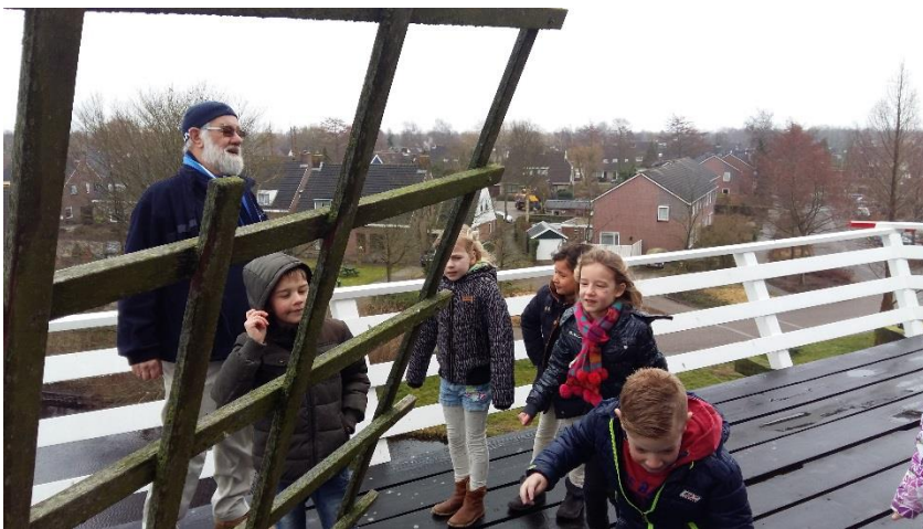
Groep 4 op bezoek bij de molen.

We hebben bakkers geknutseld, molens gevouwen en taartjes van brooddeeg gemaakt. Als afsluiting hebben de kinderen gezonde sandwiches gemaakt met tomaat, ei, komkommer, kaas en vlees. Deze werden voor 1 euro verkocht.